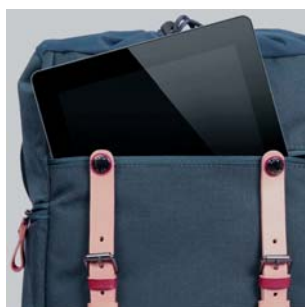
前面には9.7インチ程度のタブレットPCが収納可能