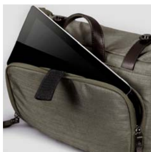
開口部には8インチ程度のタブレットPCが収納可能