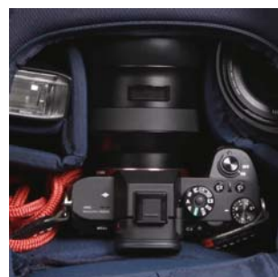
背面からはメイン収納部にダイレクトアクセス可能