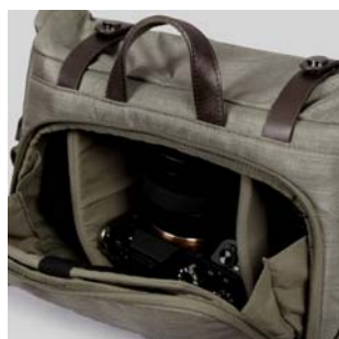
背面からはメイン収納部にダイレクトアクセス。