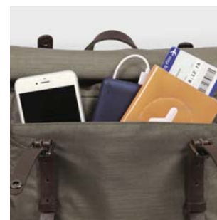
スマートフォンなどを収納。大型フロントポケット