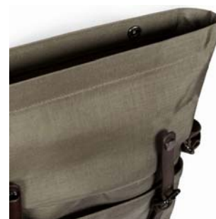
ロールトップ採用。伸ばすと驚きの大容量を収納可能

RAWシリーズに新モデル登場。さまざまなポケットなど撮影時の利便性にこだわった、大きすぎず小さすぎないショルダーバッグは撮影時にもタウンユースにも大活躍。ロールトップ部を伸ばすと収納力が大幅アップ。720mm程度のワインボトルも収納可能です。