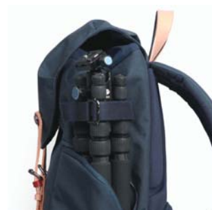
付属の三脚ベルトと側面ポケットで三脚を固定